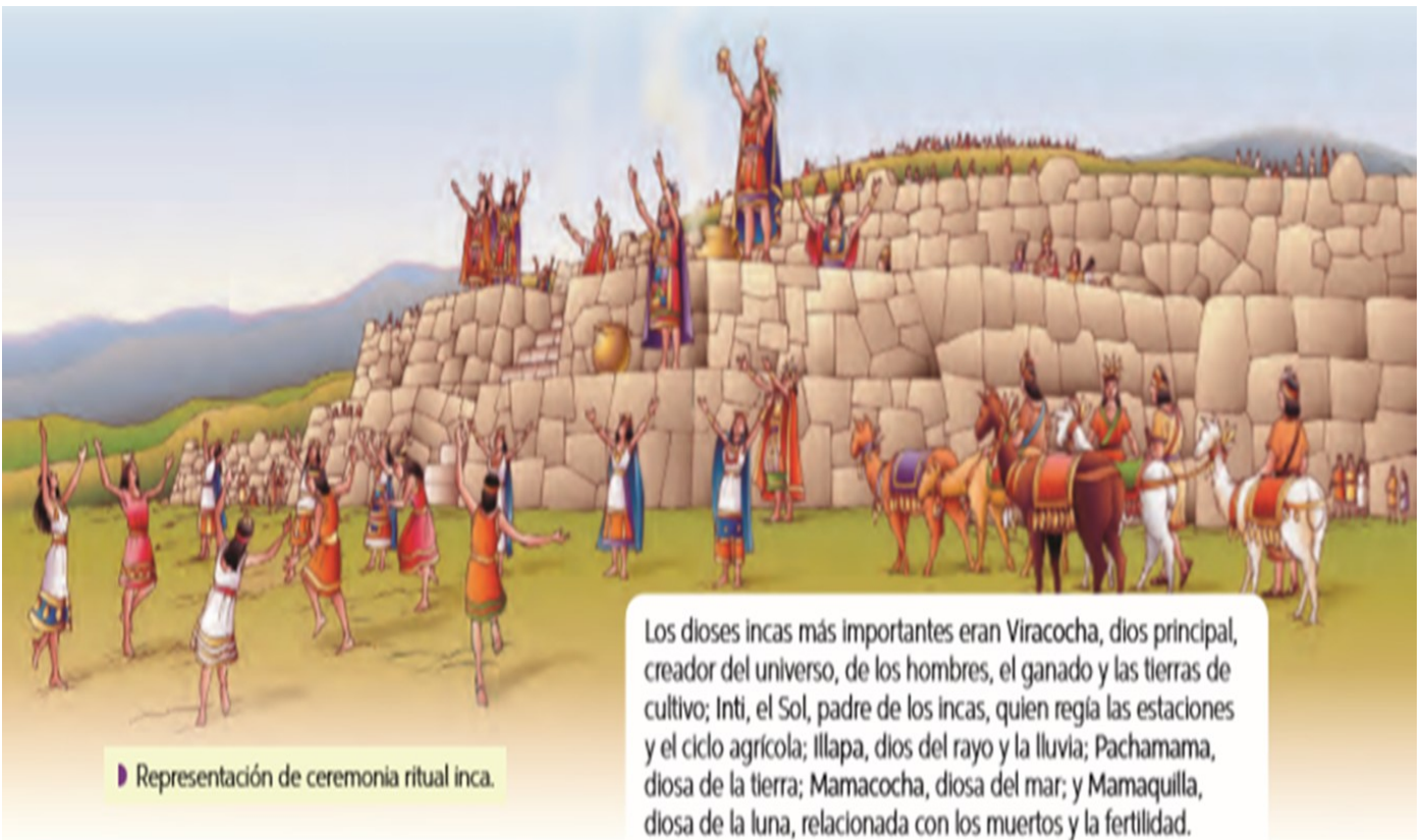
Representación de ceremonia ritual inca.

La cosmovisión inca dividía al mundo en tres partes: el mundo de arriba, donde vivían los dioses y los espíritus de los nobles; el de la superficie de la Tierra, donde vivían humanos, plantas y animales; y el subterráneo, donde vivían los espíritus de las personas comunes.