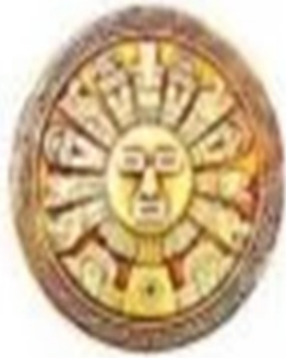
Dador de la vida