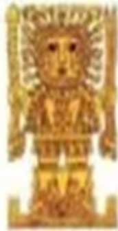
Creador del mundo Inca