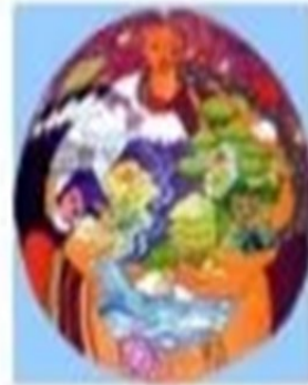
Diosa de la Madre Tierra